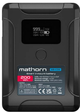
Smart V-mount battery Mathorn MB-V200