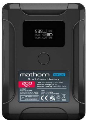
Smart V-mount akku Mathorn MB-V200